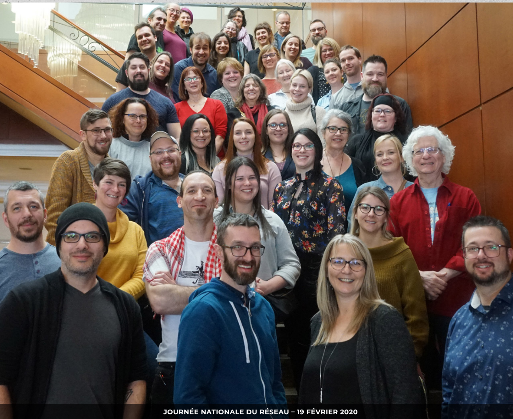
JOURNÉE NATIONALE DU RÉSEAU – 19 FÉVRIER 2020